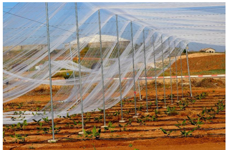
חיפוי מטע הבננות